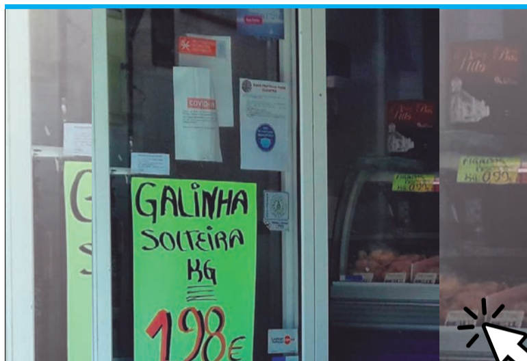
E a casada?

Apoiado em Mercado Aberto com nove trabalhadores, cinco são técnicos superiores, três auxiliares administrativos e um auxiliar de ação educativa. Na medida de Contrato Emprego Inserção+ a autarquia tem quatro utentes integrados, um técnico superior e três administrativos. Foram realizadas mudanças a nível de gestão de recursos humanos, com novas medidas para trabalhadores que se ausentem por doença.