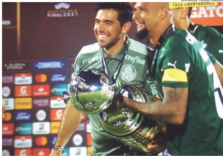
Abel conquistou Taça pelo segundo ano consecutivo

O Palmeiras abriu o marcador logo aos 5 minutos, por intermédio de Raphael Veiga, mas permitiu a igualdade do Flamengo por Gabriel Barbosa, aos 78 minutos. Os 90 minutos de jogo terminaram igualados (1-1) e a partida foi para prolongamento. E foi logo aos 5 minutos do período extra que Deyverson fez o golo que decidiu a final. O “Verdão” venceu por 2-1 e a festa foi da equipa de São Paulo. O técnico natural de Penafiel - e medalha de ouro do município penafidelen- se atribuída no dia da cidade -, tornou-se assim o primeiro treinador da história do Palmeiras a conquistar dois títulos sul-americanos. A nível continental, o português juntou-se a Roberto Scarone (Peñarol), Lula (Santos), Juan Lorenzo (Boca), Telê Santana (São Paulo) e Carlos Bianchi (Boca) no lote de técnicos que ganharam dois títulos conse-