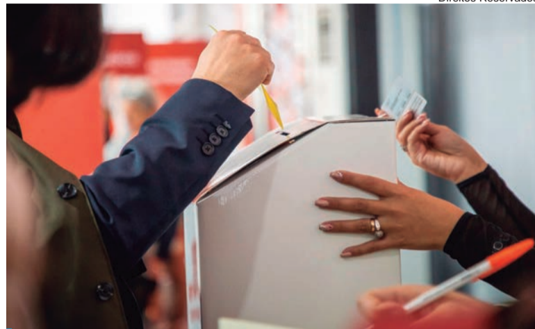
Apoio a Rui Rio foi superior no concelho

Em Paços de Ferreira, ainda que a estrutura concelhia não tenha apoiado publicamente nenhum dos candidatos, verificou-se uma percentagem de apoio à recandidatura de Rui Rio significativamente superior à obtida a nível distrital e nacional. Dos 127 militantes em situação regular, 92 exerceram o seu direito de voto: 58 escolheram Rui Rio para continuar à liderança do partido (63,74%), enquanto 33 defendiam a mudança prometida por Pau-