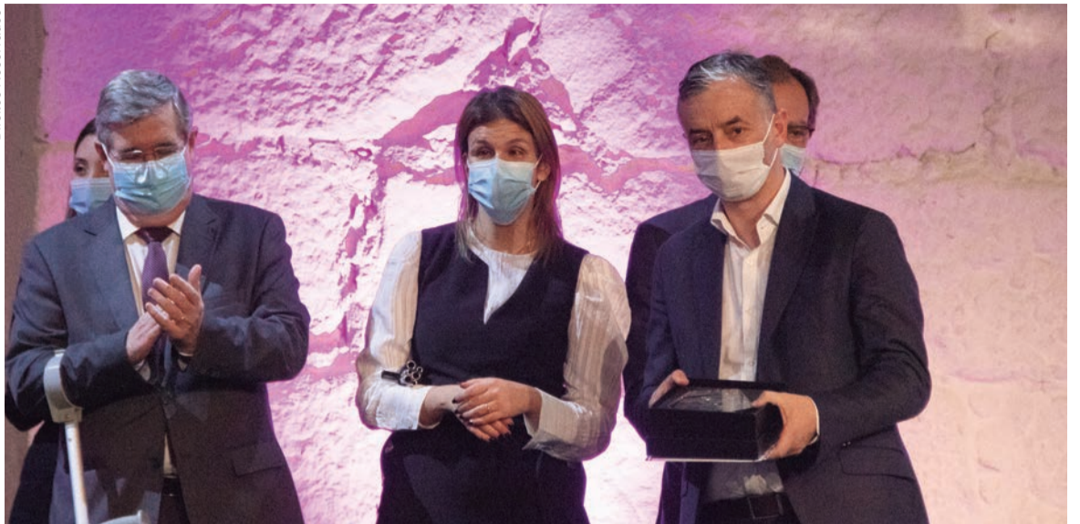
Secretária de Estado da Inclusão das Pessoas com Deficiência atribuiu galardão